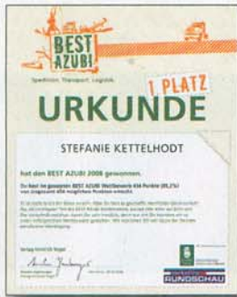
So sieht sie aus: die Urkunde der diesjährigen Siegerin